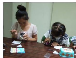
キラキラデコレーション