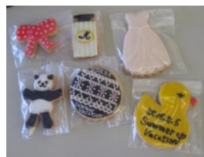
アイシングクッキーを作ろう