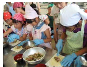
給食メニューを調理しよう