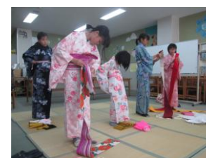
浴衣の着付けとマナー