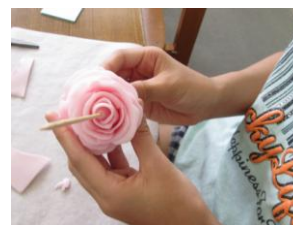
ピンクのフラワーキャンドル