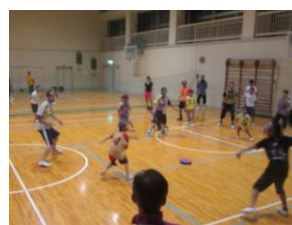
親子スポーツ教室