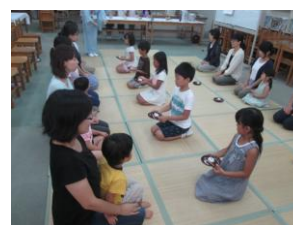
お抹茶を点てみよう