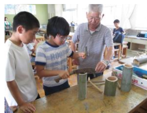
竹細工にチャレンジ