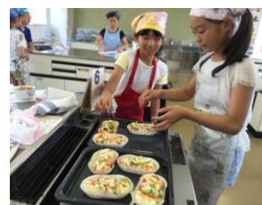
手作りパンを焼こう