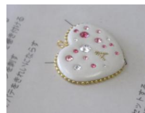
ペンダントトップを作ろう