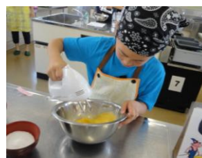
絵本に出てくるお菓子を作ろう