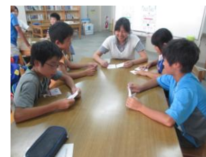
イライラ虫をやっつけよう!