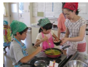
パエリア&ヘルシー豆腐パバロア