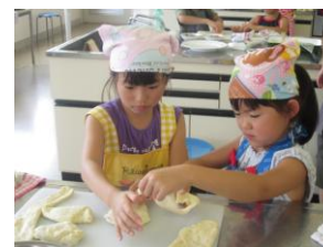
手作りナンとキーマカレー