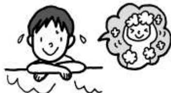
お風呂で体も髪もよく洗う