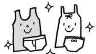
下着は毎日きれいなものを