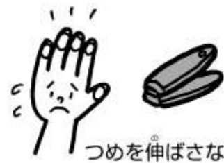
つめを伸ばさない