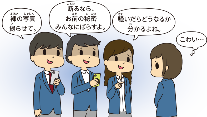
裸の写真を撮られてしまった…