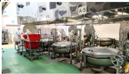
～調理作業の様子～ センターには、12個の回転釜があります。

※給食の材料費は保護者の皆様からの給食費で賄われていますので、ご協力願ひします。物資の都合上、献立が変更になることがあります。ご了承ください。