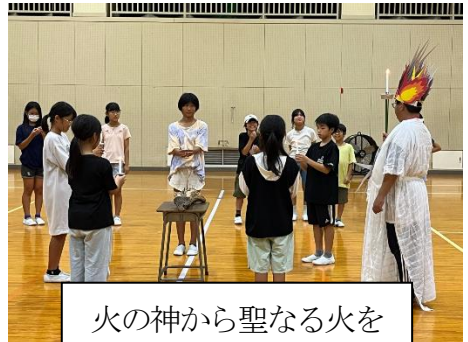
火の神から聖なる火を バトンタッチ