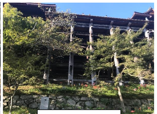
清水の舞台を望む