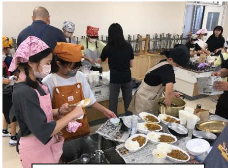
カレーできました