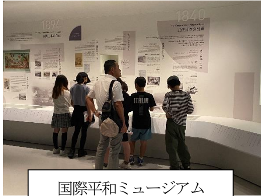
国際平和ミュージアム