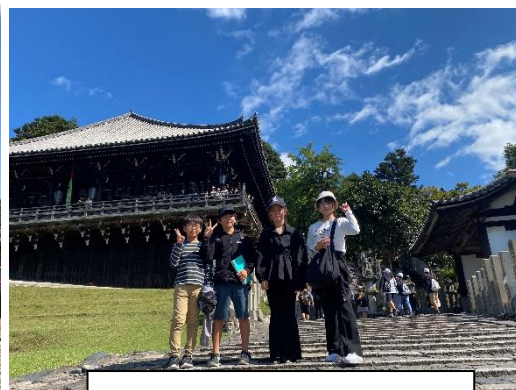
二月堂ではい、ポーズ