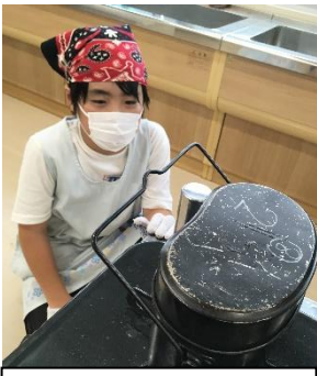
飯盒でご飯炊けるかな

9月27日（金）、5年生のデイキャンプを学校で実施しました。午前中は平和学習として、香良洲歴史資料館に行きました。午後からは、レクダンスをしたり、飯盒でご飯を炊いてカレーを作ったりしました。夕方からはキャンドルタイムや花火体験をしました。内容盛りだくさんの一日でしたが、子どもたちは最後まで、貴重な体験を楽しむことができました。