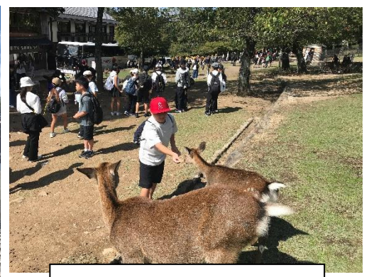
鹿せんべいはい、どうぞ