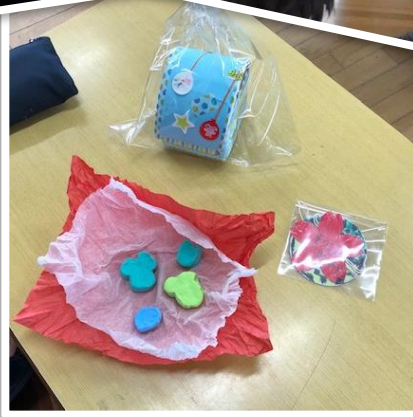
各学年からの 手作りプレゼント

6送会の後、6年生が各教室に分かれて出向き、交流するとともに、プレゼントの交換を行いました。各教室では、5年生が作成したくす玉を割り、素敵な手作りのプレゼントを6年生に送りました。丁寧に作られたプレゼントを受け取り、6年生は大事そうに持って帰っていきました。忘れられない思い出になったようです。6年生からは、毎年恒例の手作り雑巾が手渡されました。