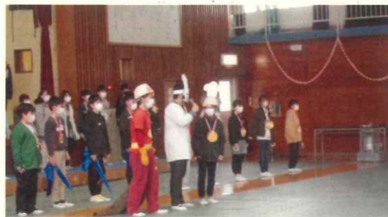
笑いのエッセンスがたっぷり! 6年生の魅力の集大成でした!