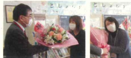
楽しいです!! 図書ボランティアさん、募ってます!

お子さんの卒業に伴って、2名の方が図書ボランティアをご卒業されました。ステキな絵本の世界へ子どもたちをいざない、豊かな心を育てていただきました。心より、感謝申し上げます!