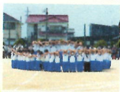
行事や授業中における子どもたちの様子を紹介