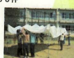
地域の皆さんを紹介