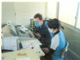
一口英語 毎週木曜日