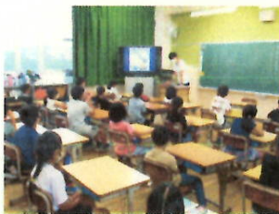
チャンツ 毎週火曜日