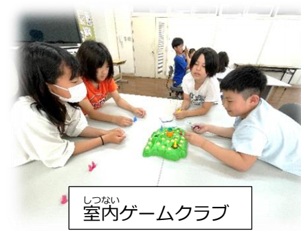
しつない 室内ゲームクラブ

地区懇談会のときに、自治会長さん（本校卒業生）から伺ったお話です。 「私が小学生の時は、新聞部があって、学校の様子などを記事にして、新聞を作り、全校に配布をしていましたよ。とても懐かしいです。今はあるのですか。」