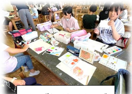
くもずわくわくクラブ