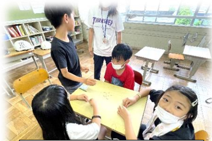
インターナショナルクラブ