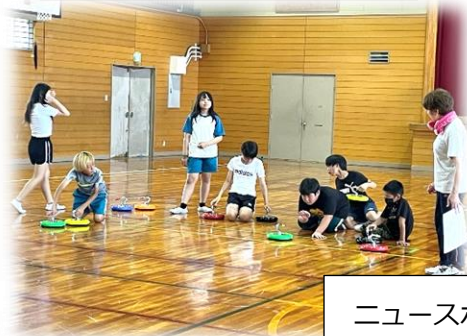
ニュースポーツクラブ