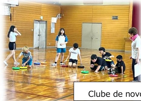
Clube de novos esportes