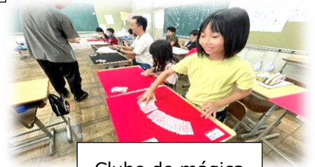
Clube de mágica