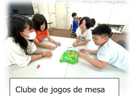
Clube de jogos de mesa

Esta conversa foi falada pelo presidente do bairro(que foi formado nesta escola ) no dia da reunião dos bairros do distrito.” Quando era aluno de primária ,tinha comitê de jornal ,fazíamos jornal e escrevíamos os acontecimentos da escola e distribuíamos para toda a escola,Sinto muitas saudades desta época ,ainda tem o comitê de jornal ? ”