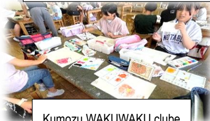
Kumozu WAKUWAKU clube