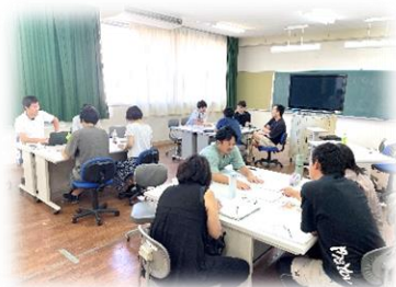
Aula de pesquisa durante as férias de verão.

A base da aula é ouvir uns aos outros. Também pudemos reafirmar que "ouvir uns aos outros" em pares e grupos é essencial para que todas as crianças aprendam umas com as outras. Gostaríamos de compartilhar a perspectiva da educação em direitos humanos que nossa escola cultivou e o valor de que "erros e não compreensão podem tornar tesouros" com todos os professores e trabalhar para melhorar ainda mais nossas aulas.