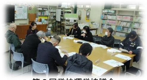
第 3 回学校運営協議会