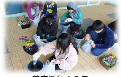
花育活動 4 5 年