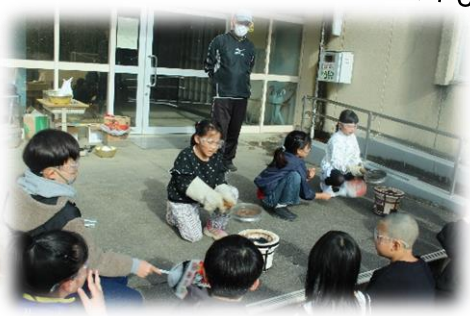
らっかせいを食べよう 2 3 年