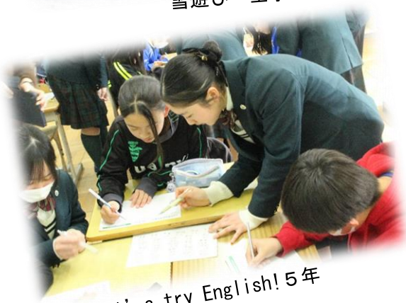
Let's try English! 5 年