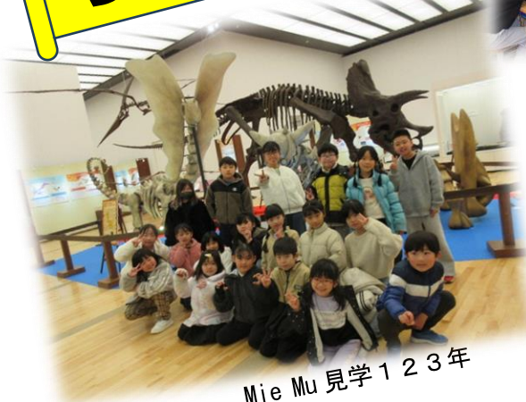
Mie Mu 見学 1 2 3 年