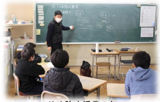
いじめ防止授業 6 年