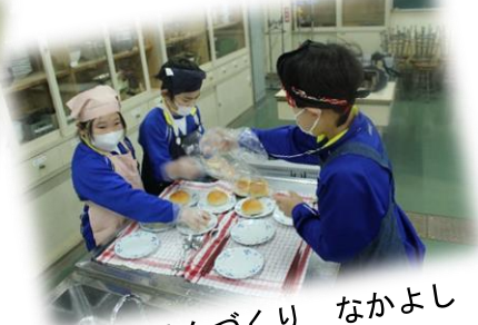
朝ごはんづくり なかよし