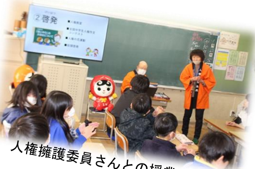
人権擁護委員さんとの授業 4 5 年