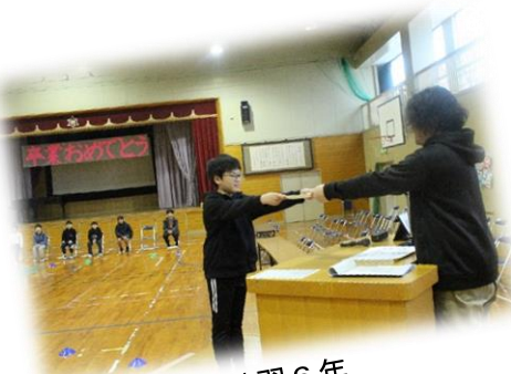
卒業式練習 6 年