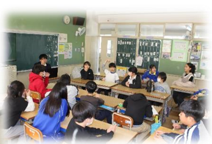
いじめ防止授業 4 5 年