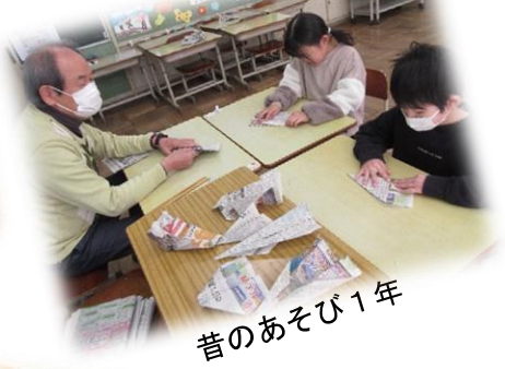
昔のあそび 1 年