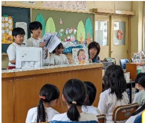
クイズわかったよ！

6月4日は「虫歯予防デー」。給食・保健委員会では、歯と口の健康週間に前に、6月3日（月）図書室で『むしばあちゃん』という絵本の読み聞かせを行いました。読み終わったらクイズを出して、参加賞にかわいいてるてる坊主をわたしていました。また、毎年6月5日は県下一斉「学校環境デー」です。よりよい環境づくりに向けて積極的に取り組む子どもの育成をめざし、各学校が創意工夫した活動を実施しています。神原小学校では、6月3日（月）の掃除の時間に、「全校草ひき」に取り組みました。また、「くるりんペーパー強化週間（6/10～14）」として、3・4年生が、くるりんペーパー協力の呼びかけをし、スタンプカードやプレゼントを用意して、資源リサイクル活動に取り組みました。