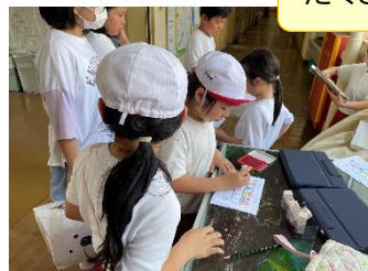
たくさん集まったね！