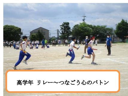
高学年 リレー～つなごう心のバトン