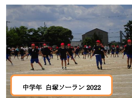
中学年 白塚ソーラン 2022