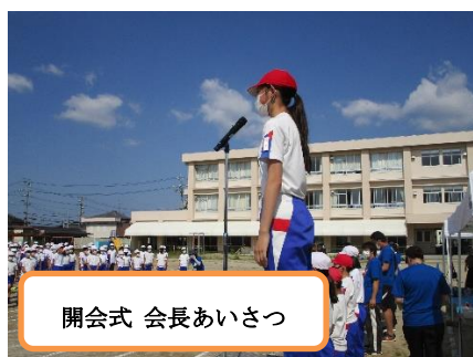
開会式 会長あいさつ

子どもたちが演技や競技に一生懸命取り組む姿を保護者の皆様に見ていただき、本当に良かったと思います。保護者の皆様には感染防止対策や子どもたちへのあたたかい応援等で、ご理解とご協力していただき、ありがとうございました。