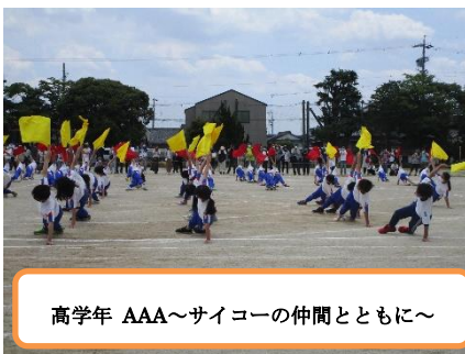
高学年 AAA～サイコーの仲間とともに～