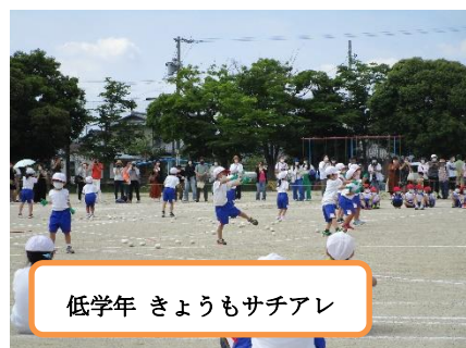
低学年 きょうもサチアレ