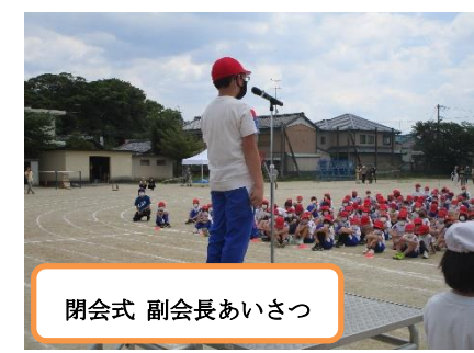
閉会式 副会長あいさつ