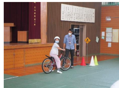
動き出す時は右後方も確認