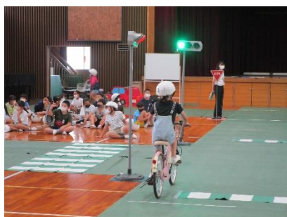
青信号でも左右確認