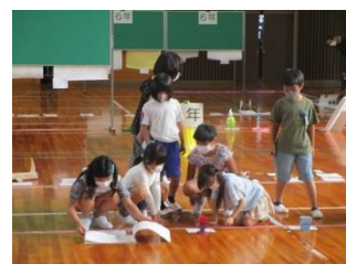
<興味津々で見学する子ども達>

社会の自由研究では、白塚の獅子舞ややぶねり、白塚漁港等、理科の自由研究では、雲や雷、私たちのからだ等、自分達の身の回りの事柄や日常の生活の中で子ども達が疑問に思った事柄について調べ、写真や図、グラフなどを使って分かりやすくまとめてありました。