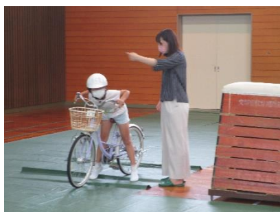
見通しの悪い所は一旦停止して左右確認

お話を聞いた後、実際に自転車を使って安全な乗り方について詳しく教えてもらひました。教えていただいたことを守って、事故にあわないよう自転車に乗るようにしましひう。