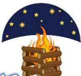
キャンドルファイヤー