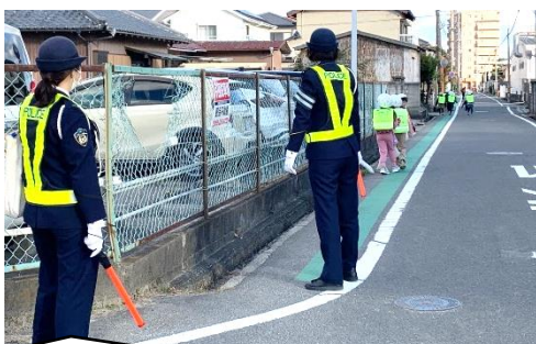
津新町駅前交番のお巡りさんによる下校指導