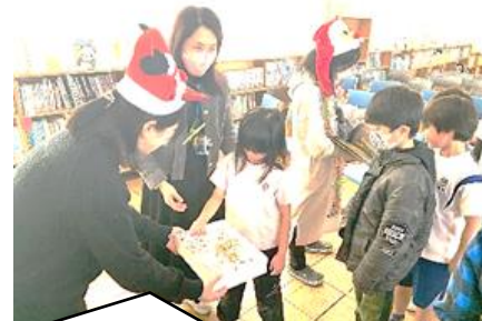
図書館ボランティアさんによる読み聞かせとプレゼント