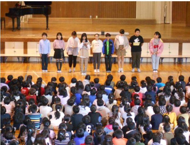
人権フォーラム参加者による報告