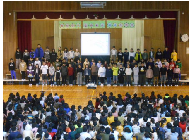
6年「自分みがきの旅に出よう」