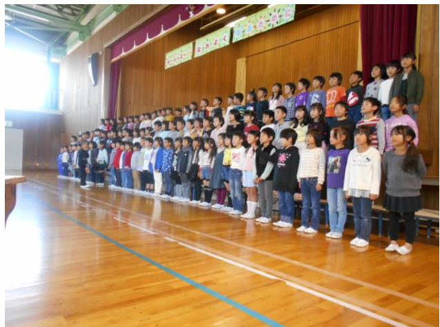
2年「紹介します～高茶屋のいいところ～」