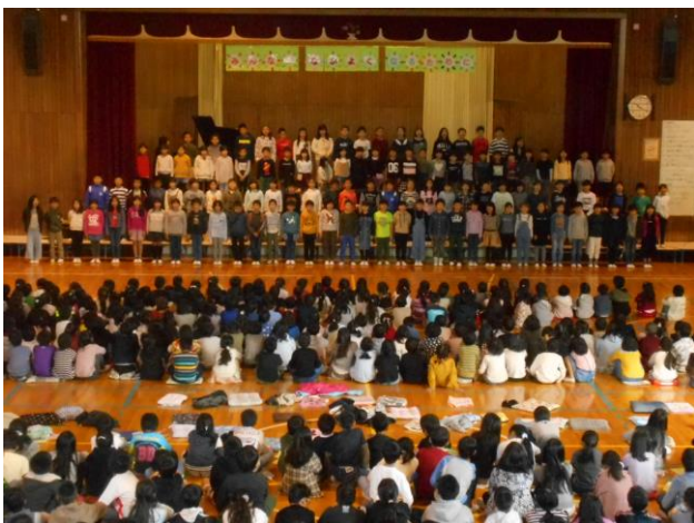
3年「みんながってみんないい」