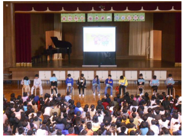
人権委員会朗読「みえることみえないこと」