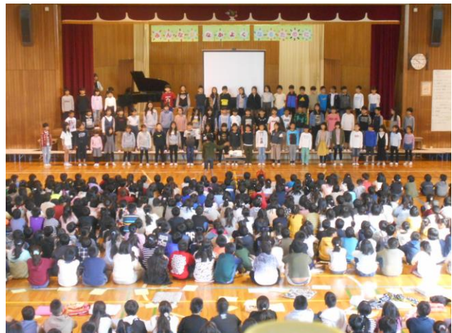
4年「みんなが笑顔になるために」