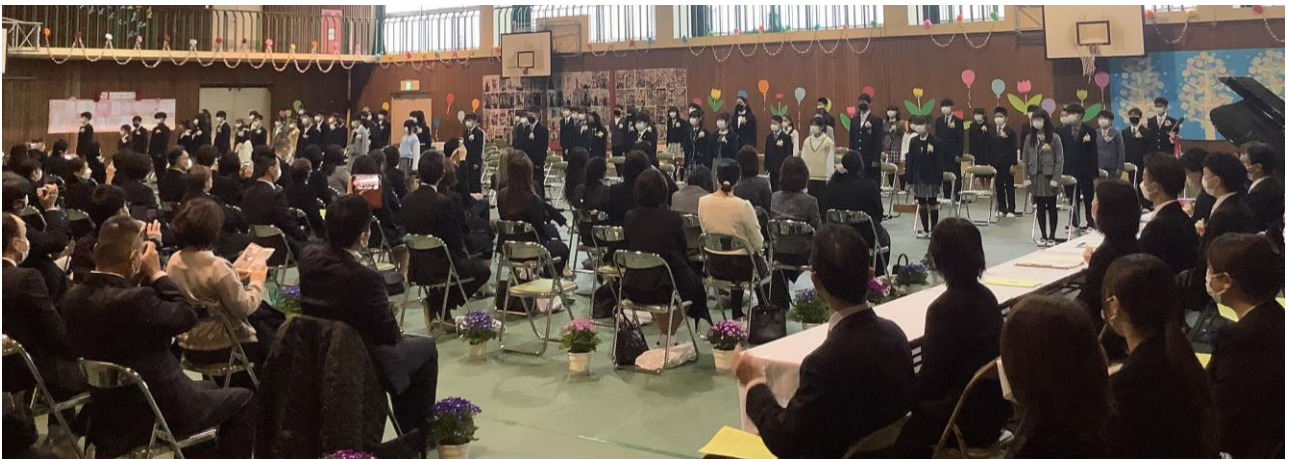
6年生からの贈り物です。

そして、3月18日の卒業証書授与式は予定通り、卒業生、保護者、教職員で行われました。お家の方も1家族2名まで来ていただくことができました。6年生の堂々とした卒業証書を受け取る姿、心を込めた呼びかけ、そして、美しい声で心に響く歌。厳粛な中にも温かさのあるとてもいい卒業証書授与式でした。