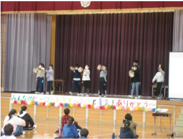
4年生「思い出クイズとタンブリンダンス」