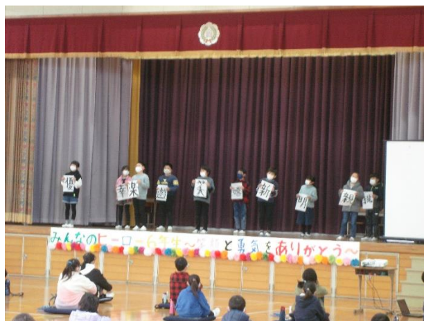
2・3年生「6年生を一文字で表したら」