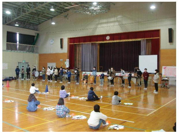
5年生 「打楽器パフォーマンス～6年生といっしょに～」