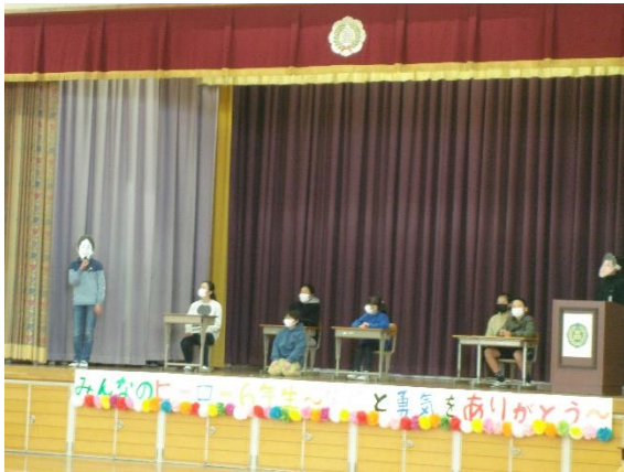
6年生 「Our Best Memories～with eternal friends」