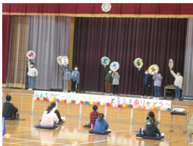
1年生「ありがとう6年生」

来年度は、コロナ禍が収まり、高野尾地区のみなさんが、体育館で直接観覧できる「六年生を送る会」になることを願っています。