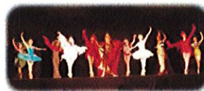
動物のカーニバルより

百獣の主ライオンを先頭に動物たちのにぎやかな行進です。つづいてニワトリ、ロバ、ウサギ、カメ、火の鳥、鯨と次々に登場します。楽しい動物たちの踊りを観てくださいね！