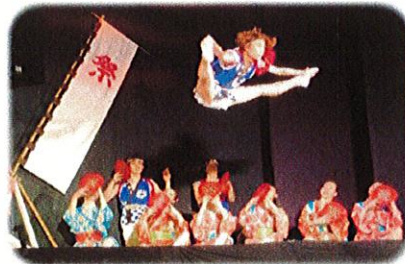
日本のバレエ『祭』より